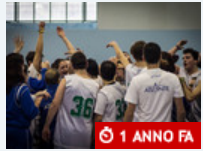
Altri sport Baskin: buone prestazioni per le Aquile e gli Orsi braidesi alla Palestra delle Pellizzari