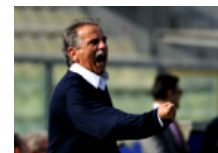
"Cuore granata": Emiliano Mondonico e Claudio Sala a Cuneo