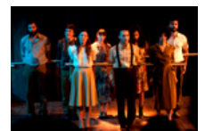
"Sporting", uno spettacolo per gli atleti di Amico Sport al Toselli di Cuneo...