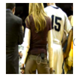
Ecco la giornalista sportiva più sexy: lo dice Playboy