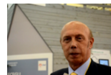
A Saluzzo il calcio incontra la storia con i grandi del Toro